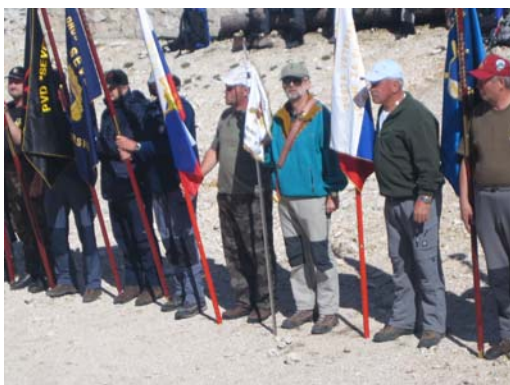
Nuestro Guión en Kredarica