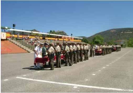
Entrega de Certificados, XXXI Prom.