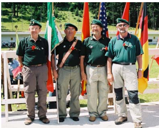
Delegacion Española en Eslovenia