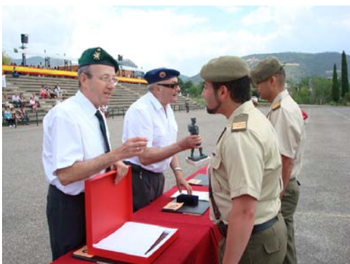
ENTREGA DEL PREMIO