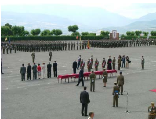
D. JUAN CARLOS SALUDANDO A LAS AUTORIDADES