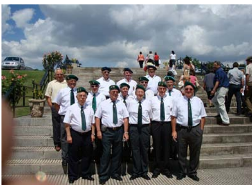
ARTILLEROS EN LA ACADEMIA