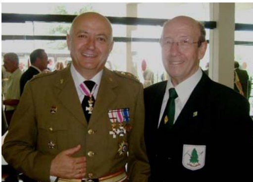
EL CORONEL SACRISTAN CON NUESTRO PRESIDENTE

VII PREMIO INDIBIL Y MANDONIO. En el brillante acto de "Entrega de Certificados" acto que sirve de prólogo a la Entrega de Reales Despachos de Sargento, en la Academia General Básica de Suboficiales (A.G.B.S.) en Tremp (Lleida); el pasado 3 de julio se hizo entrega del Premio Indíbil y Mandonio.