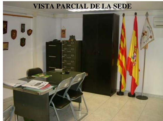
VISTA PARCIAL DE LA SEDE