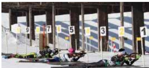
Fotos EMMOE: 1-Tiro con Carabina Tendido 2- El Esfuerzo del Recorrido

Debido a la peculiaridad de esta modalidad, es una prueba en la que destacan los corredores de equipos militares y de la Guardia Ci-