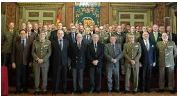
Fotografía de familia en el Salón del Trono de Capitanía General de Barcelona

El pasado 23 de enero, convocado por el TG Excmo. Sr. D. Fernando Aznar Ladrón de Guevara, Jefe de la Inspección General de Ejército, se celebró en el Palacio de Capitanía General de Barcelona un acto conmemorativo del que hubiera sido el 75 aniversario de la División de Montaña Urgel 4, para rendir homenaje y mantener en el recuerdo a esa Gran Unidad de nuestro Ejército tan vinculada a esta región de España y que con su carácter marcó la vida de muchos, algunos de los cuales, en activo o en otras situaciones, seguimos vinculados a estas tierras.