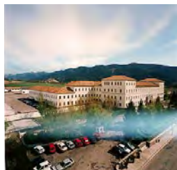
Vista del Gravelinas