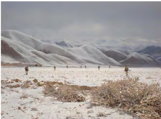
Patrulla de control de zona en las inmediaciones de Darra i Bum