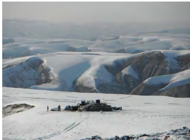
Posición de Pelotón en las inmediaciones de la COP deGOLOJIRAK